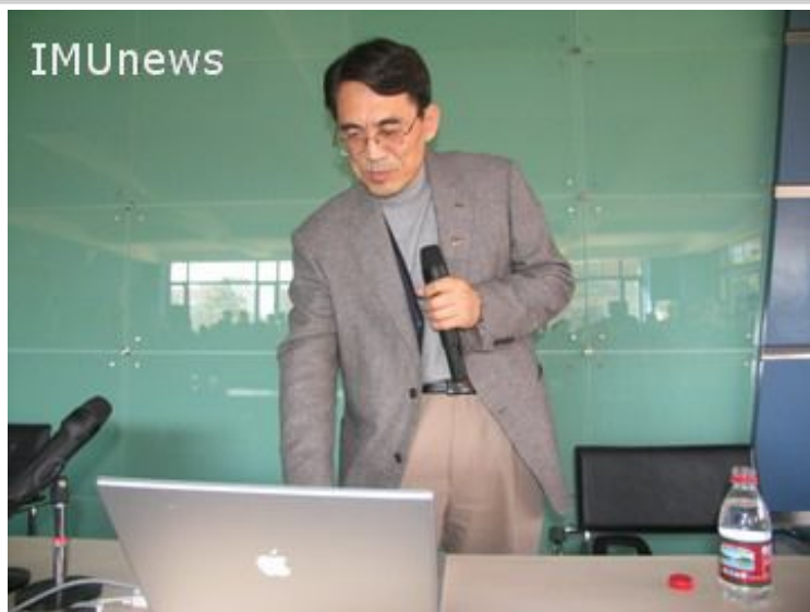
美国亚利桑那州立大学邬建国教授